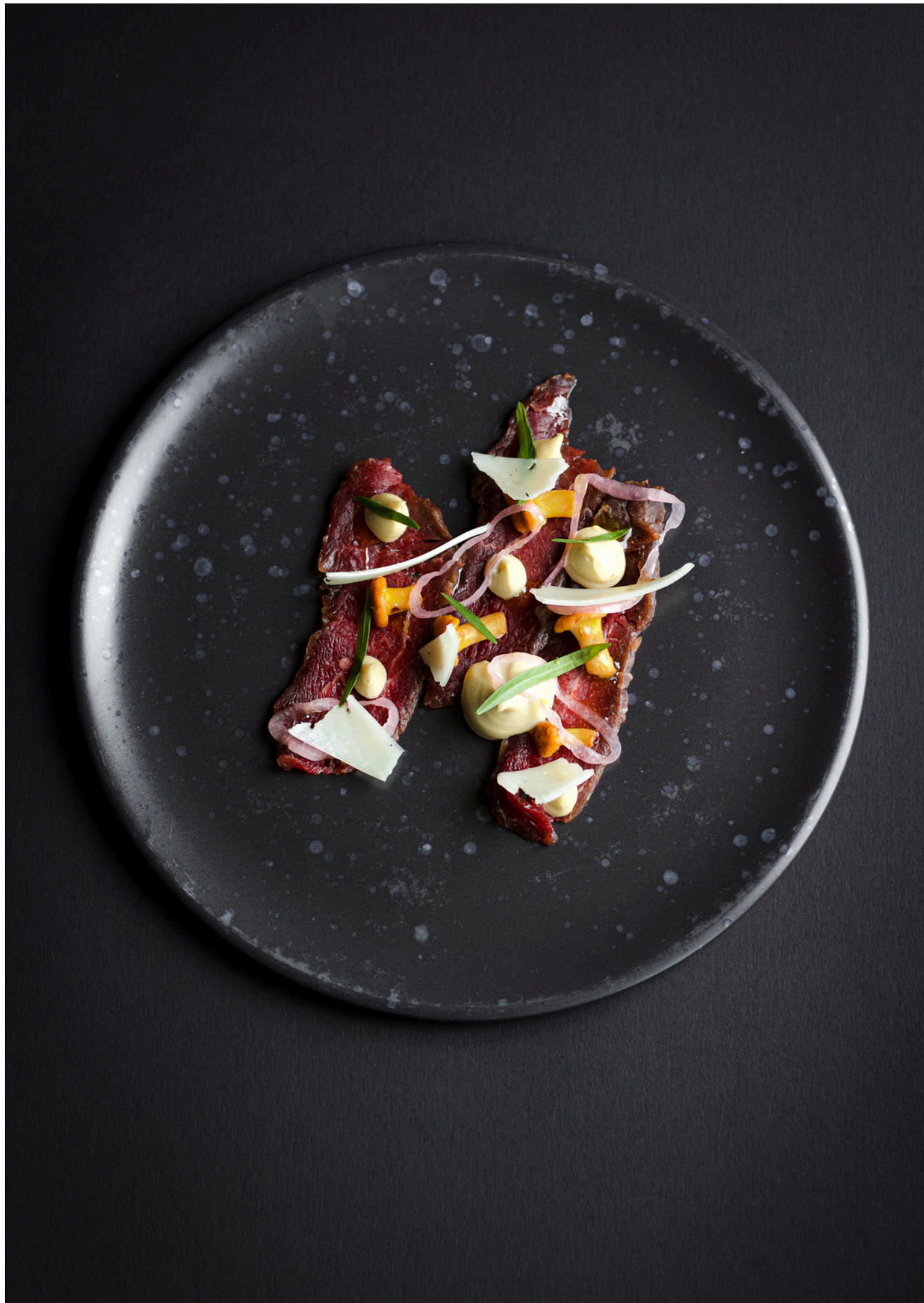
Uzkoda / Burtnieku ezera zandarts / briedis un gailenes