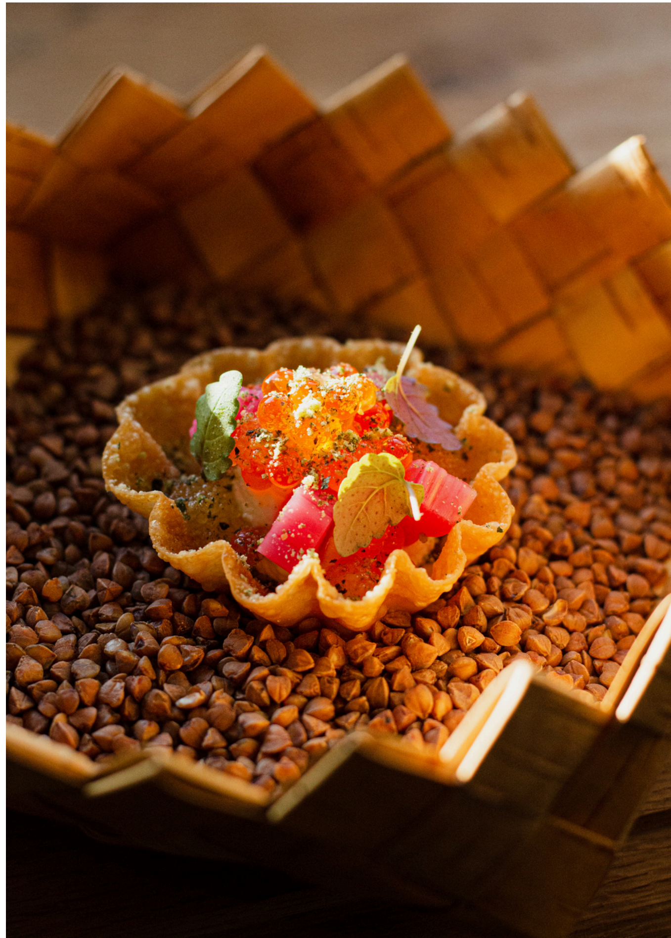
Komplimentāras uzkodas / viss no topinambūta / rabarberi un foreles ikri