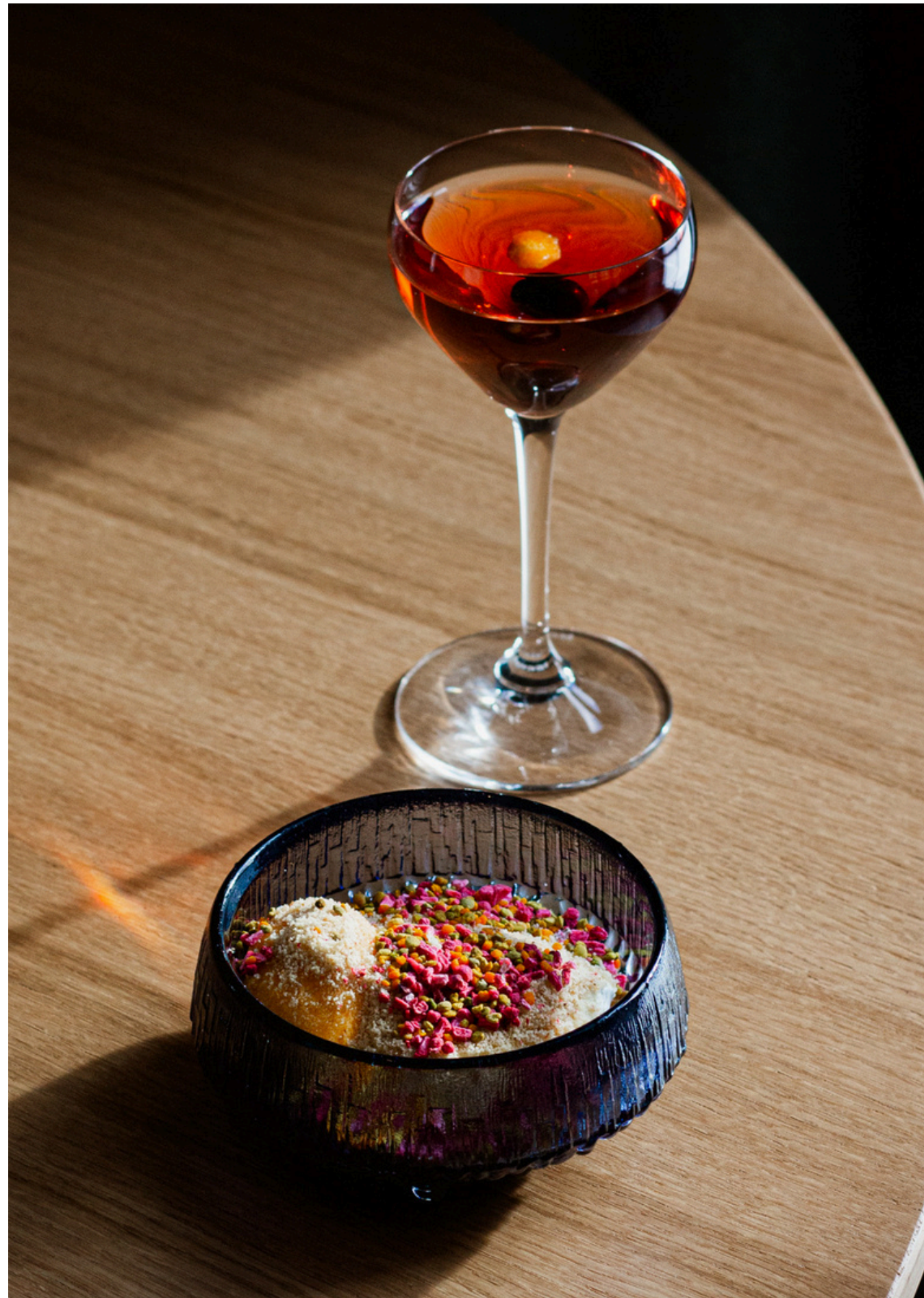
Deserts / rabarberi / ăboli un sălă karamele