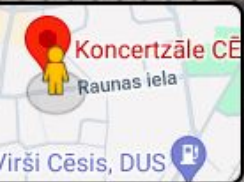
Vidzemes koncertzāles "Cēsis" ieeja

Un, protams, vēl viena lieta, kas ir ārkārtīgi būtiska, kur mēs Latvijā pieklibojam, ir tā ekspluatācija kā tāda. Mēs jau arī iepriekš runājām par to, ka vienā brīnišķīgā izstāžu zālē var nodrošināt pieejamu no fiziskās vides viedokļa, var uztaisīt tualeti, bet ekspluatācijas laikā saprot, ka tā tualete ir... Ir jāpārtaisa par apkopējas kabinetu, vai kādā sporta iestādē tur, piemēram, tur ir šūšanas darbnīca iekārtota , jo pie mums tādi cilvēki nenāk, un tad beigās izrādās, ka tā pieejamība ir uz papīra, bet tā... Patiesībā reālajā dzīvē viņas jau nav arī, un tas tā kā bēdīgi ir.