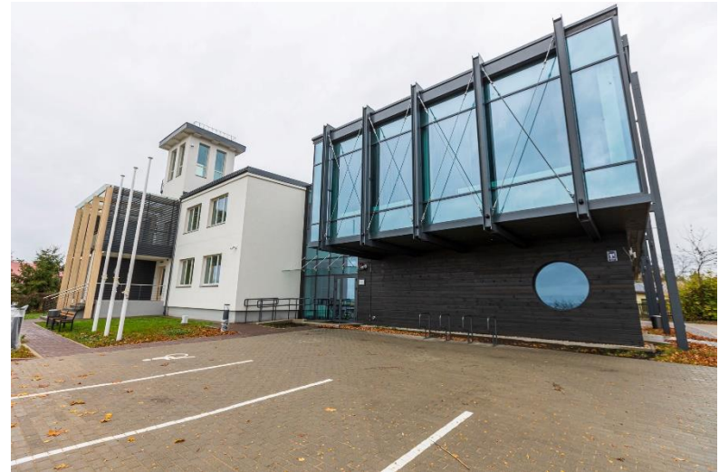
Jūrmalas ūdenstūrisma pakalpojumu infrastruktūras attīstība atbilstoši pilsētas ekonomiskajai specializācijai