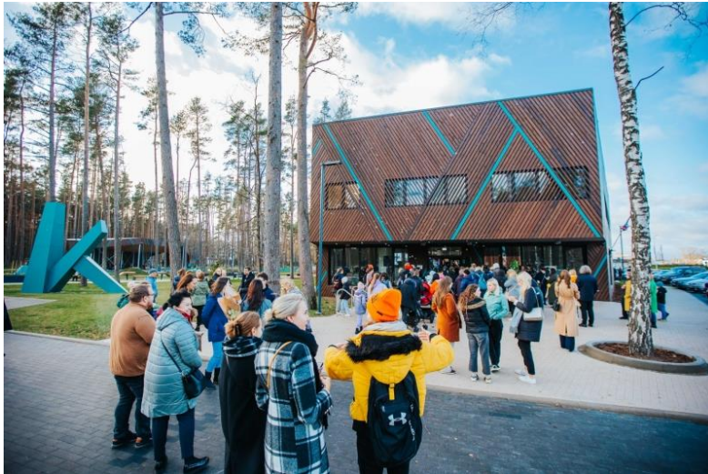
Pilsētas atpūtas parka un jauniešu mājas izveide Kauguros