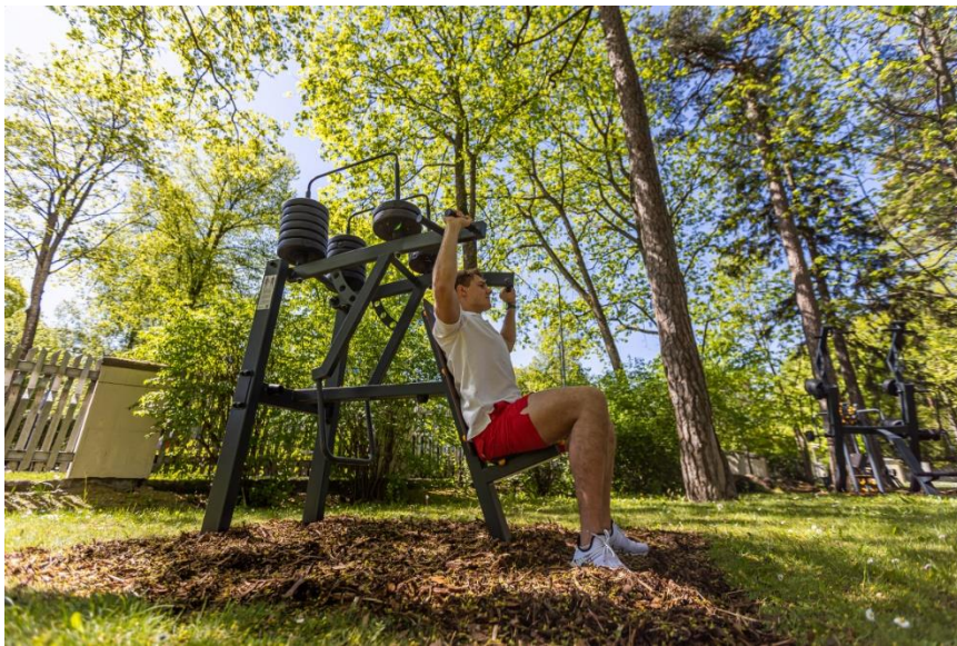
SIA BBH Investments- Sporta trenāžieru uzstādīšana brīvā dabā