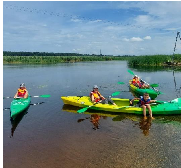
SIA 2GR - Laivošanas maršruti Lielupē ar kajakiem