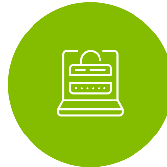
Zinātne un pētniecība, izglītība