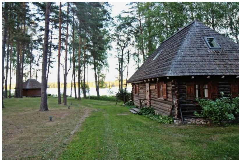
Viesu nams “Gungas”