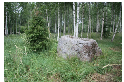
Vitolēnu Velna pulkstenis.