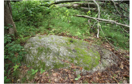
Jaunutēnu bedrīšakmens.

8. Lielāks tūrisma potenciāls ir objektiem, kas iekļaujas esošajās tūrisma plūsmās, atrodas salīdzinoši netālu no citiem tūrisma aprītē esošiem objektiem vai tūrisma maršrutu tiešā tuvumā. Vidzemē izteiktas apzināto dabas svētvieta koncentrācijas zonas ir: Kocēnu novads (Vaidavas, Kocēnu pag.), Burtņiekus ezera Z – Mazsalaca – Sēji.