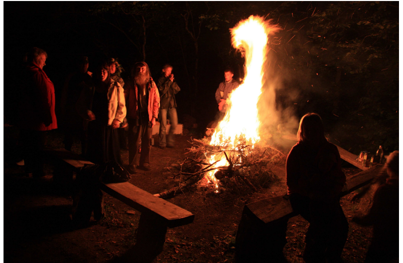
Vasaras saulgriežu ugunskurs senā dabas svētvietā ar cilvēkiem apkārt, kuri ieradusies īpaša pieredzējuma meklējumos.

iespēja salikt pareizos akcentus īstajās vietās ar misiju: pārdomāta tūrisma veicināšana kultūras vērtību saglabāšanai un reģiona identitātes stiprināšanai.