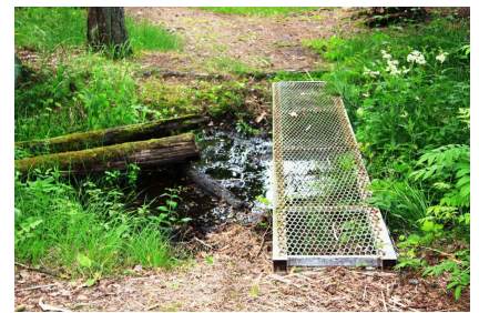
Briņķu silavota stāvoklis 2011.gada vasarā.