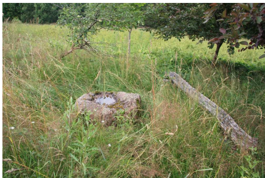
Jēču bļodakmens.