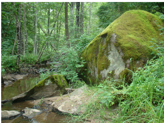
Skroderu akmens.