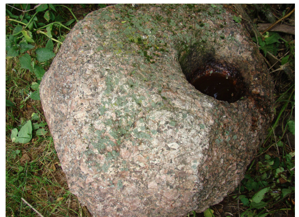
Lielspicrēnu kausakmens.