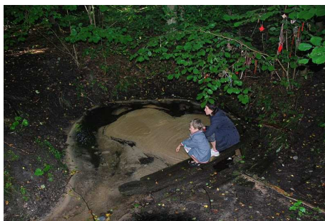
Apsēkojot objektus - Kurmāles svētavots.