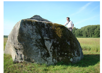
Meikītāru akmens.

ekspedīcijas pārklājot visu reģiona teritoriju. Visizplatītākais objekts Zemgalē ir svētakmens - aptuveni puse no visiem objektiem ir tieši akmeņi. Unikāli ir Zemgalē atrodamie bedrīšu akmeņi, kā arī bļodakmeņi. Ekspedīciju laikā tika atklātas jaunas, pirms tam neregistrētas svētvietas.