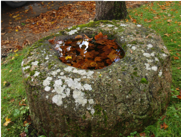
Alsungas dobumakmens.

Ir tādas ar materiālo un reizē arī ar garīgo pasauli saistītas cilvēces universālijas, kas piemīt visiem cilvēkiem visos laikmetos un visās vietās. Piemēram, cilvēkam ir nepieciešama patvēruma, nakšņošanas, dzīves vieta, kas dažādos laikos un vietās var būt visai dažāda (māja, zemnīca, ala, koka lapotne utt.), bet jebkurā gadījumā, tāda vieta būs un šīs vietas iekārtojums atstās kādas zīmes reljefā. Līdzīga universālija ir tas, ko mēs tagad saucam par svētvietām. Cilvēks vienmēr ir ticējis kaut kam augstākam, ko sauca dažādos vārdos, un atrada