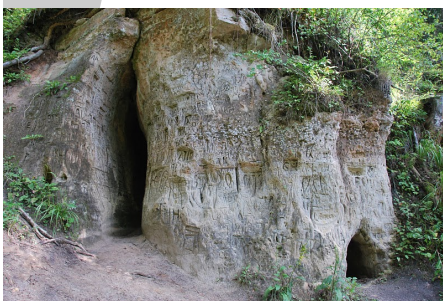
Alas Abavas ielejā.

šim nezināmi bedrīšakmeņi. Kurzemei ļoti raksturīgi ir arī elku kalni, unikālas ir divas senās svētbirzes, to paliekas, kas nav vairs atrodamas citviet Latvijā.