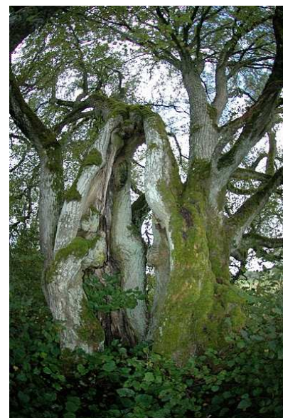
Allažu svētliepa. Foto: no Kurzemes plānošanas reģiona arhīva

Foto: no Kurzemes plānošanas reģiona arhīva