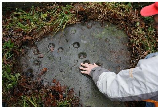
Talsu Jāņandreu bedrīšakmens.

pazemes tukšumu jeb alu, un ir vietas, kur alas ir plaši izplatītas. Skaidrs, ka alas kā svētvietas varēja pastāvēt vien tur, kur alas kā tādas bija. Līdzīgi ir arī ar citām dzīvās un nedzīvās dabas vietām, kas pat ne sevišķi lielajā Baltijas jūras reģionā ir jūtami atšķirīgas. Senās svētvietas ir specifiskas vietas: no vienas puses tās ir materiālas, no otras puses - ir saistītas ar augstu garīgumu, tāpēc tās atrodas kaut kur uz garīgā un materiālā robežas; uz garīgumu norāda kaut kas materiāls. Ļoti grūti ir definēt, kas ir svētvietā, jo vietu par svētvietu padara cilvēka attieksme. Piemēram, tiek