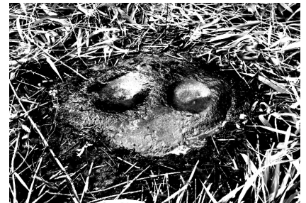
Riņņu kalna šķīvjakmens.