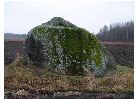
Meļķītāru akmens.

vietas, kur satiksme ar šo augstāku bija vairāk iespējama nekā citās vietās. Pat ja cilvēks deklarējis, ka viņš netic nekam, tad tomēr viņš tic, ka netic nekam, un arī šāda neticība/ticība var atstāt materiālas liecības, piemēram, neticīgo izbūvētajā ateistu stūrītī, klubā vai kaut kā citādi. Satiksme ar augstāko materiālā nozīmē varēja būt ļoti dažāda, piemēram, tā varēja būt pielūgšanas un upurēšanas vieta, tā varēja būt kaut kas līdzīgs tam, ko tagad mēs sauktu par meditācijas vietu, tā varēja būt vieta, par kuru zināja, ka tajā vienkārši mājā kādi augstāki spēki, kas vienkāršajam cilvēkam nemaz tā arī nedevas zināmi. Senās svētvietas veidoja zināmu tīklu, kurā varēja būt atšķirīgas