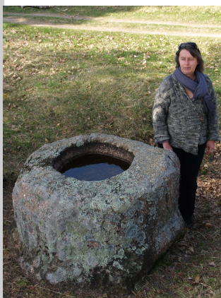
Ulmales Piņņu dobumakmens.

Kā redzam, tad dažādās kopsakarībās senās svētvietas var būt un arī ir ļoti dažādas, atšķirīgi saprotamas, dažādus cilvēkus dažādi uzrunājošas, tomēr tās ir cilvēku dziļākās būtības veidošanās, tāpēc neatkarīgi no dažādiem apstākļiem senās svētvietas arī atšķirīgiem cilvēkiem ir saprotamas un pieņemamas.