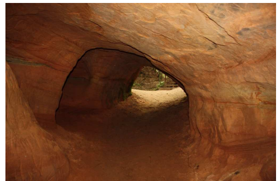
Mazsalacas Velna pagrabs.