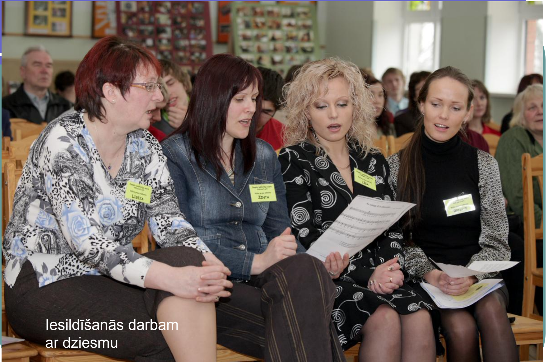
Iesildīšanās darbam ar dziesmu