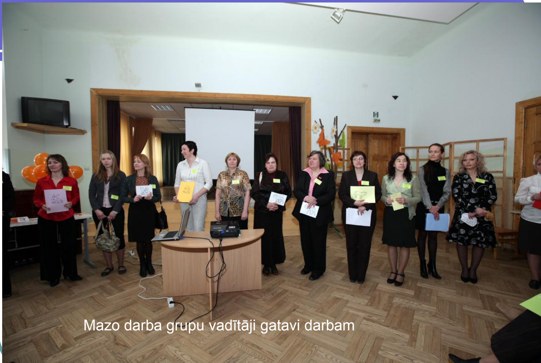
Mazo darba grupu vadītāji gatavi darbam