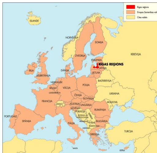
RĪGAS PLĀNOŠANAS REĢIONS EIROPĀ